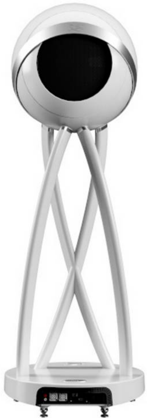
Face arrière avec les connectiques

La personnalité connectée de ce modèle repose sur un module Wi-Fi ainsi qu'une prise Ethernet. Pour organiser tout cela, Cabasse utilise une fois encore