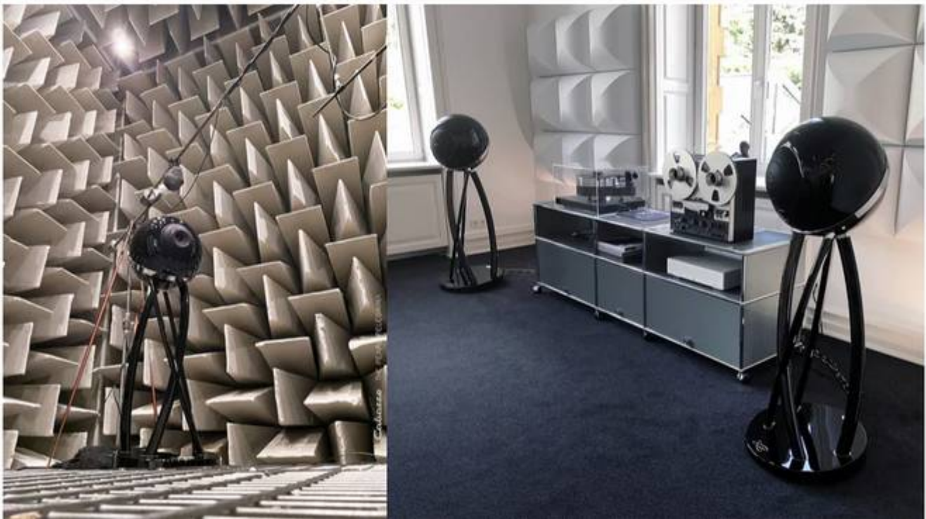
Chaque The Pearl Pelegrina est fabriquée sur mesure à Plouzané (Finistère), au QG de Cabasse.

Rappelons enfin que, tout comme les autres enceintes The Pearl, la “grande” Pelegrina est une enceinte sans-fil connectée, celle-ci embarque donc tout le nécessaire pour communiquer sur le réseau, récupérer les flux en streaming et en local et les convertir (Wi-Fi, Bluetooth, DAC 768 kHz/32 bits). La nouvelle version de l’application StreamControl de Cabasse/AwoX est à disposition de l’utilisateur pour configurer et piloter l’enceinte. La connectique se trouve à l’arrière du socle : RJ45, port USB-A, 2 entrées XLR, entrée optique, entrée RCA.