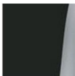
BLACK HIGH GLOSS